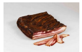
Bauchspeck ohne Schwarte per kg € 12,90